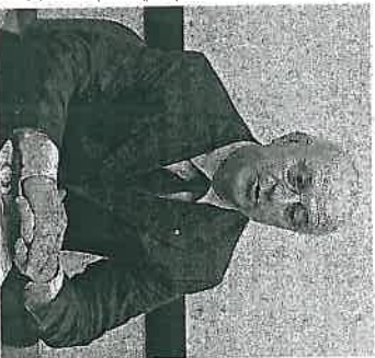
Il presidente Ernesto Quinto

in via Palestro 66. Al saluto di Quinto, seguirà una breve introduzione di Massimo Vacchiano, giudice delegato al fallimento, il quale sta per lasciare la sede di Cremona, per la corte d'appello di Brescia. Per Quinto, il corso sarà anche l'occasione per ringraziare il giudice Vacchiano in merito al lavoro svolto in tribunale.